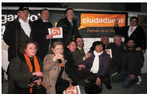
En la imagen, compañeros de C's y de "Cuba Democracia Ya" ante la embajada.