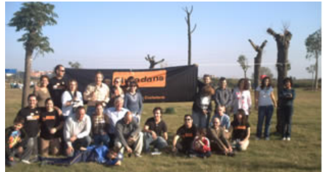
Las 19 Agrupaciones de la Federación BCN-provincia realizan muchas actividades.

En la foto, algunos miembros de la Agrupación del Baix Llobregat Sud en un acto reivindicativo-festivo en defensa del río Llobregat y su entorno.