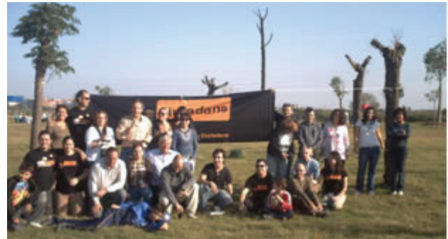
Las 19 Agrupaciones de la Federación BCN-provincia realizan muchas actividades.

En la foto, algunos miembros de la Agrupación del Baix Llobregat Sud en un acto reivindicativo-festivo en defensa del río Llobregat y su entorno.